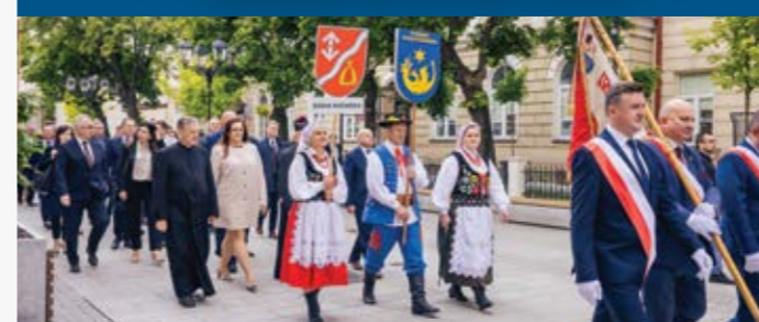
Barwny przemarsz z Kościoła Farnego do Wojewódzkiego Domu Kultury w Rzeszowie