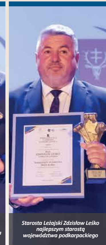
Starosta Leżajski Zdzisław Leško najlepszym starostą województwa podkarpackiego