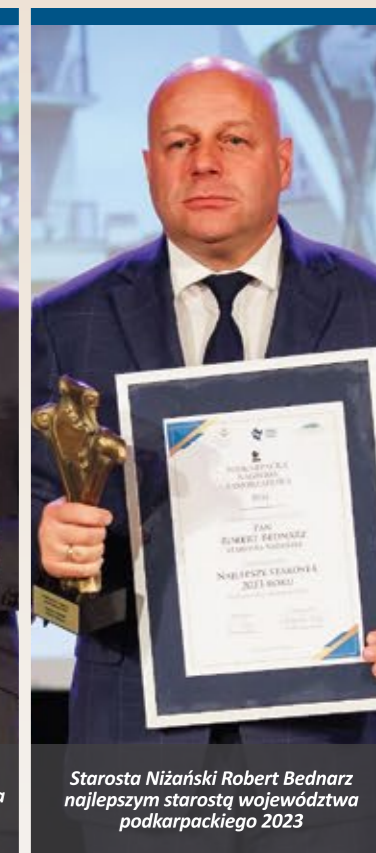
Starosta Nizański Robert Bednarz najlepszym starostą województwa podkarpackiego 2023